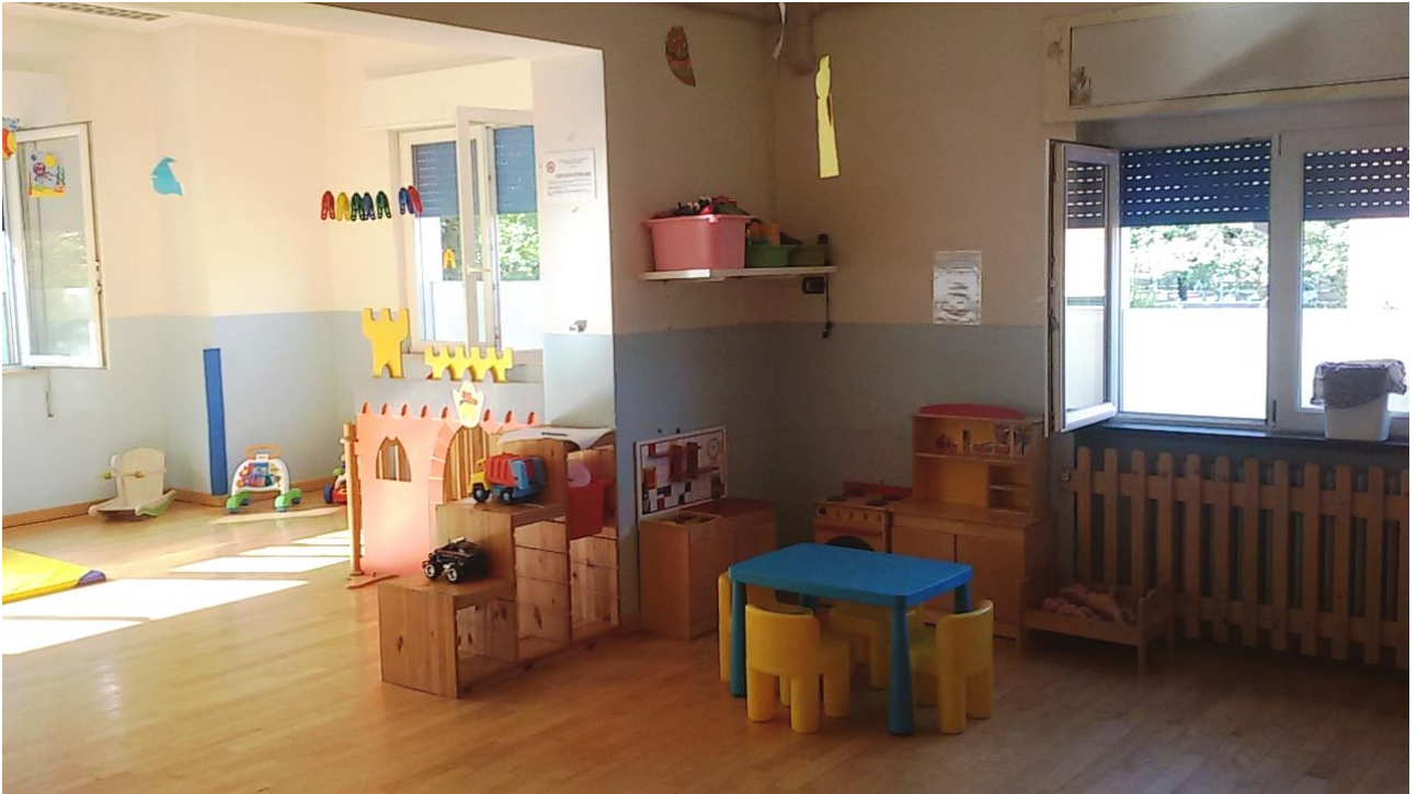
Foto 3 – Area sezione lattanti/piccoli in cui sarà realizzato nuovo locale fasciatoio